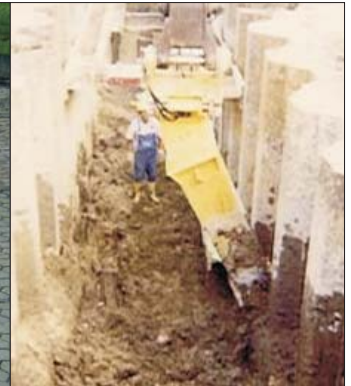
Reinigen von Spuntwänden